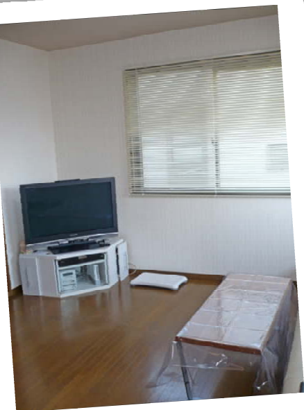
living シンプルな部屋にコーナーの 多機能テレビ台、これならWii フィットも楽しめますね♪