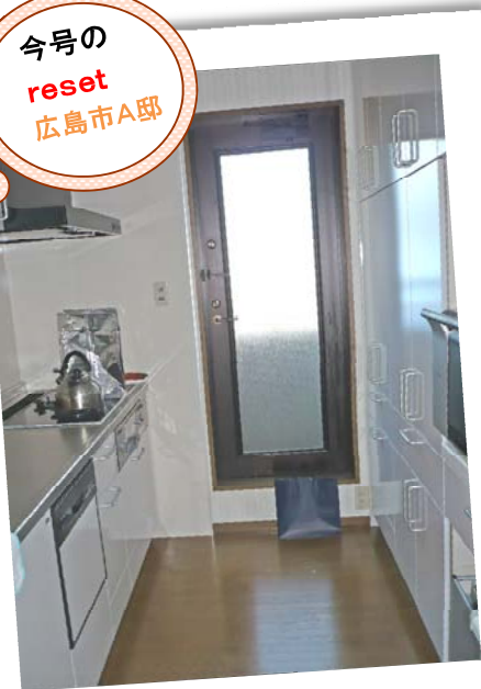
kitchen スッキリ！ お料理も楽しくできます♪